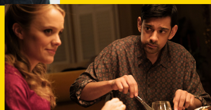
Tall Dark and Handsome