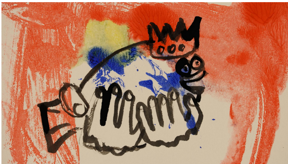
The flounder.

Six films normands et britanniques très courts, explorant des genres et des techniques différentes, seront projetés jeudi 9 décembre 2021, de 19h à 20h, au centre social l'Agora. La projection sera suivie d'un échange avec plusieurs réalisateurs locaux.